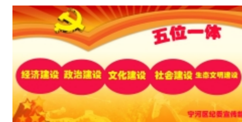
制作主体幻灯片学习