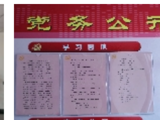
利用党务公开栏学习