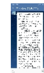
微信每日一题学习

四是制作主题幻灯片。制作10张关于学习宣传贯彻十九大精神的屏保，发放到全系统纪检监察干部手中，方便随时随地学习十九大精神，切实营造浓厚学习氛围。